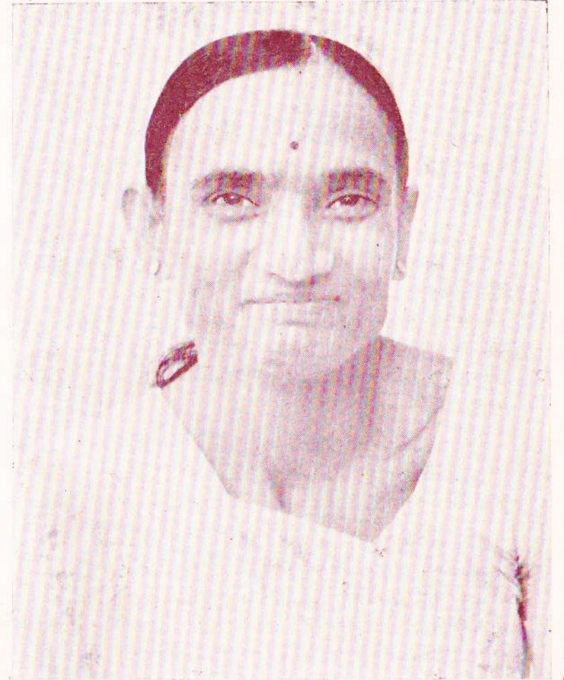
પૂ. મા શ્રી સર્વેશ્વરી

સર્વેશ્વરી મહાદેવી, સર્વલોક નિવાસિની, નમું તમને, નમું તમને, વારંવાર નમું નમું.