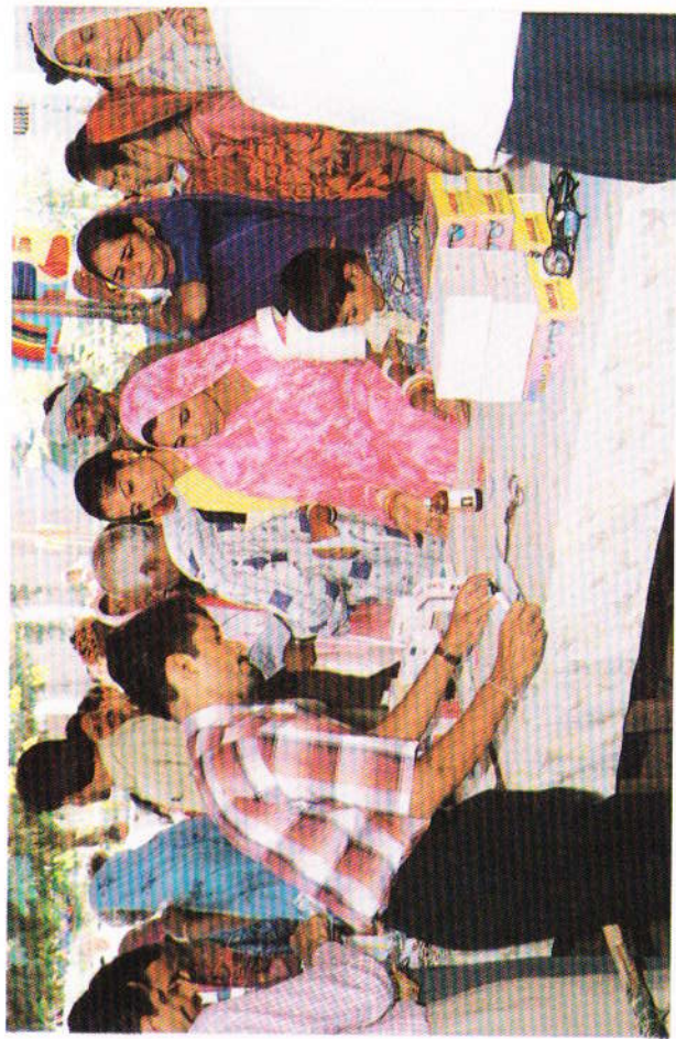
પૂ. શ્રી માની દુઆ સાથે દવા વિતરણ કરતાં સ્વયંસેવકો.