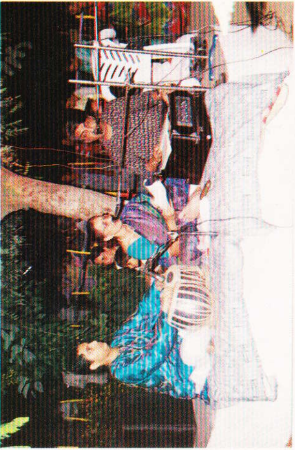
વીણા તારી અંદર જો વાગો, હૃદય ભરે છે રાગો. ગરબા ને ભજનોના ભક્તિરસ વહાવતા સંગીતકારો ને ગરબે ધૂમતા ભક્તો.