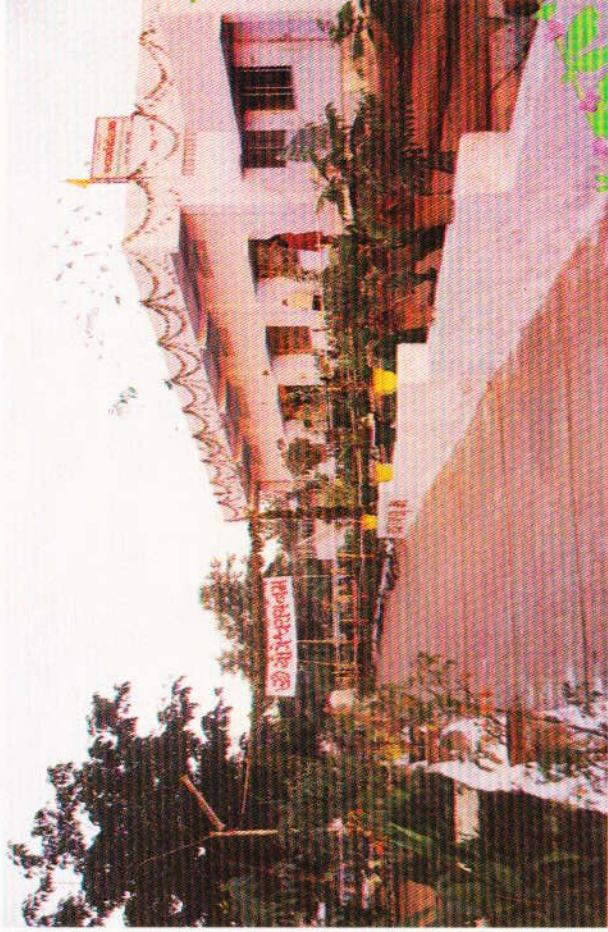
સ્વર્ગારોહણને શ્રી શાંતિભાઈ કનેરીયા ટ્રસ્ટનો પ્રામ થયેલો પ્રસાદ. ' શોગણીવલ્લભમ્ '