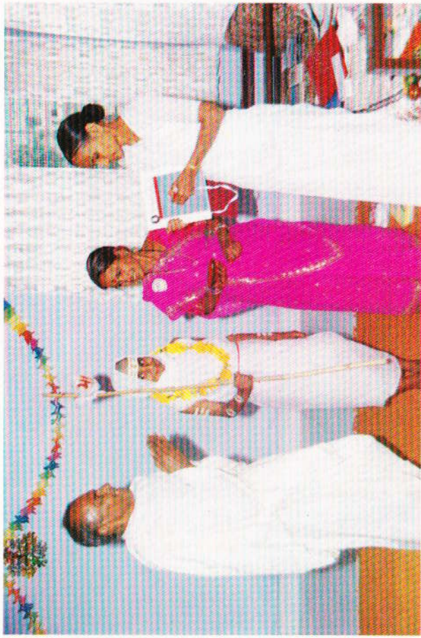
સ્વર્ગારોહણના નવા ચોકીદાર શ્રી મહેન્દ્રભાઈના ભાગક થિ. તુષારનો મહોપવીન સંસ્કાર.