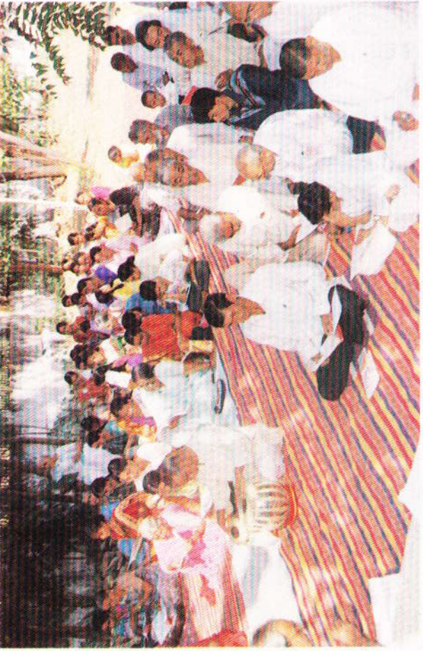
મેડીકલ કેમ્પની સાથે સાથે સ્વર્ગારોહણના પાછલા ભાગમાં વૃદ્ધોની છાયામાં પારાયણ કરતી સાધકો.