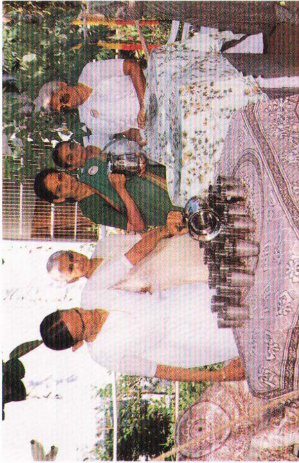
‘ મનથી ભજ મુજને અને તનથી કર સેવા.’ પરભે પાણી પાવાની સેવા કરતાં પૂ. શ્રી મા.