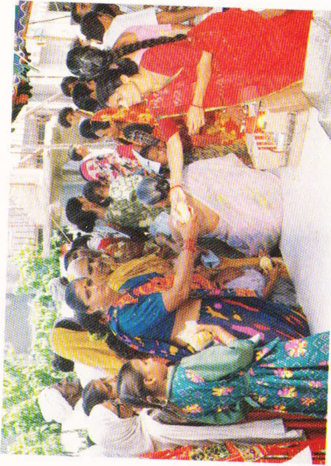
દર્દીઓને દવાઓના વિતરણ પછી મુંદી અને ગાંઠિયાના નાસ્ત્રાના પેકેટ સાથે સરલ ળીના પણ મફત આપવામાં આવેલ તેનું દૃશ્ય.