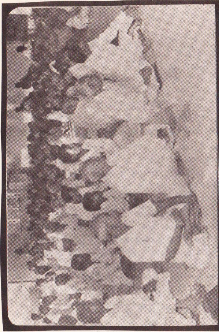
અંબાજીના સ્વર્ગોહણ તીર્થમાં નવા બંધાયેલ સત્સંગ હોલમાં નવરાત્રિ જપપક્ષમાં સાધક ભાઈબહેનો સમૂહમાં ભાગ લઈ રહ્યાં છે. (તા. ૨૧ થી ૩૦ સપ્ટેમ્બર ૧૯૯૮)