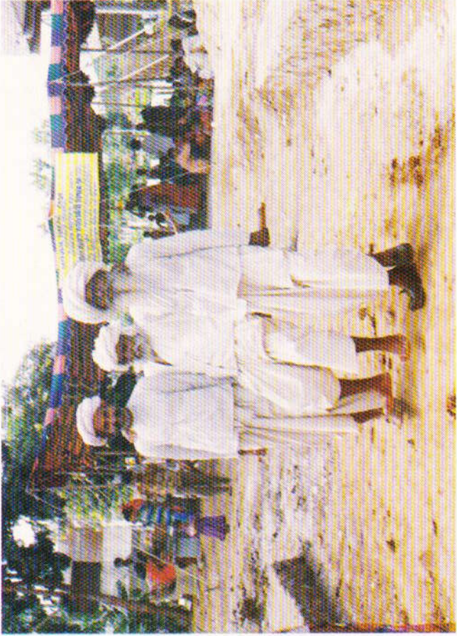
નિદાન કેમ્પમાં દાકતરોને બતાવી બે રબારીઓ એક વૃદ્ધને ખભાઓનો ટેકો આપી બહાર લઈ જઈ રહ્યા છે.