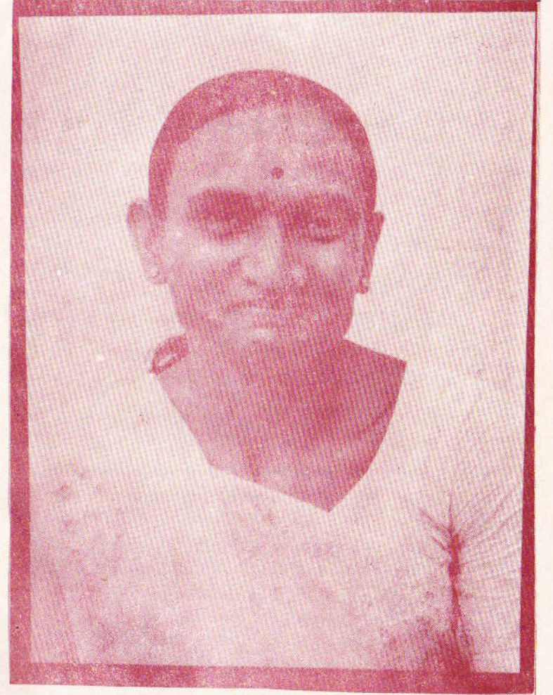
મા શ્રી સર્વેશ્વરી